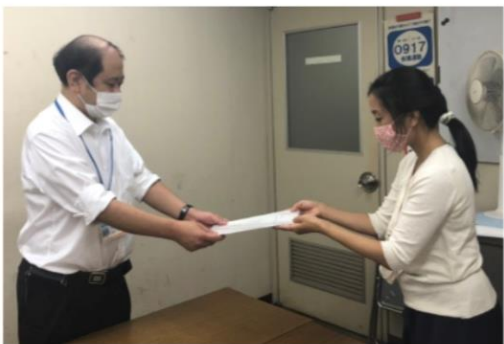
要望書提出の様子

八田議長、幸光副議長にお時間をいただき、市連協の活動について理解を深めていただきました。